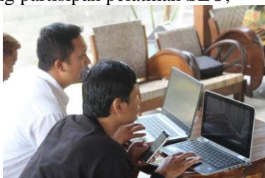
Gambar 5. Praktik Langsung Membuat Website Domain Wordpress

Pelatihan selanjutnya ialah praktik langsung pembuatan website dengan wordpress . Anggota komunitas Jeep Adventure Parang Menoreh diminta untuk membuat akun wordpress masing-masing dengan email yang dimiliki karena dengan akun tersebut peserta pelatihan dapat membuat sendiri konten untuk websitenya. Berikut adalah proses praktik langsung partisipasi pelatihan SEO,