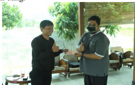
Gambar 7. Pemenang Kompetisi Pengisian Header, Sidebar dan Footer Pada Website Domain Wordpress

Selanjutnya waktu yang kompetisi pengisian header, sidebar dan footer telah habis sehingga didapat satu pemenang yang mendapatkan nilai tertinggi dan diberi hadiah yakni uang.