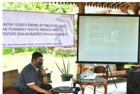
Gambar 4. Penyampaian Materi oleh Narasumber

Materi awal yang diberikan oleh narasumber ialah struktur website yang baik terdiri atas home serta beberapa konten utama, kemudian konten utama ini memiliki beberapa subkonten (Sulianta, 2014). Konten utama merupakan artikel yang paling banyak dicari pengunjung dimana memakan waktu paling lama dari konten-konten lainnya. Hal ini dikarenakan konten utama adalah sebuah umpan untuk visitor berkunjung ke website. Oleh sebab itu pembuatan konten tidak boleh sembarangan tetapi harus berdasarkan referensi dari sumber terpercaya dan dibuat dengan alur yang jelas.