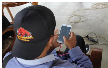
Gambar 6. Peserta Sedang Berkompetisi Untuk Memperoleh Poin Tertinggi dalam Mengisi Header, Sidebar dan Footer

Bagi peserta yang memiliki nilai paling tinggi diantara peserta yang lain maka akan mendapatkan hadiah berupa uang. Bisa dilihat pada gambar dibawah ini, peserta sedang serius mengisi header, sidebar dan footer dengan link ataupun deskripsi yang terkait dengan tema website mereka sebagai berikut,