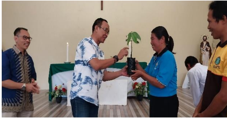
Gambar 5. Penyerahan Bibit