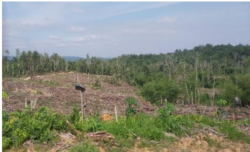
Gambar 9. Kondisi Lahan di Sekitar Hutan Lindung