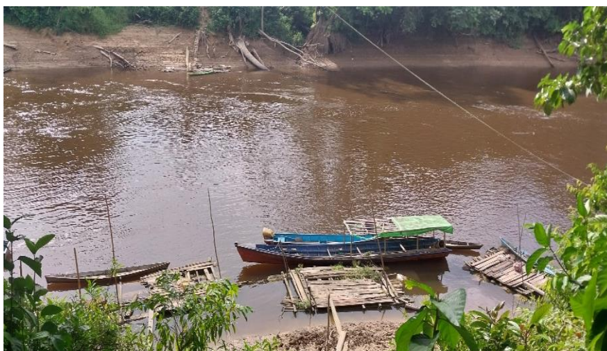
Gambar 10. Kondisi Sungai yang Melewati Hutan Lindung dan Desa Saat Kemarau