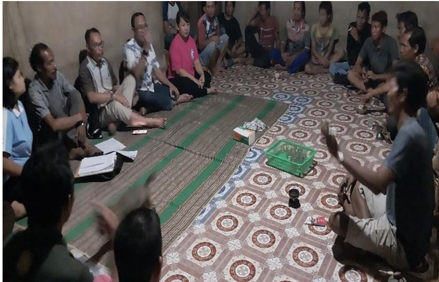
Gambar 8. Diskusi Bersama Warga