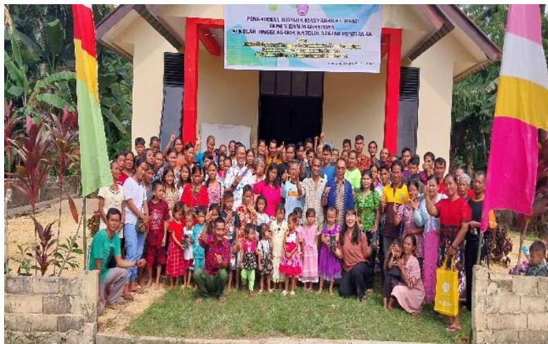
Gambar 6. Foto Bersama Warga