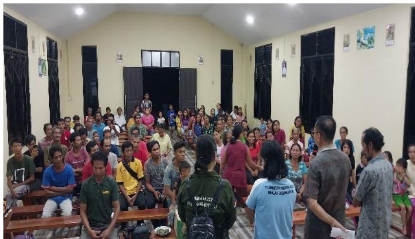
Gambar 3. Pembukaan Katekese Ekologi