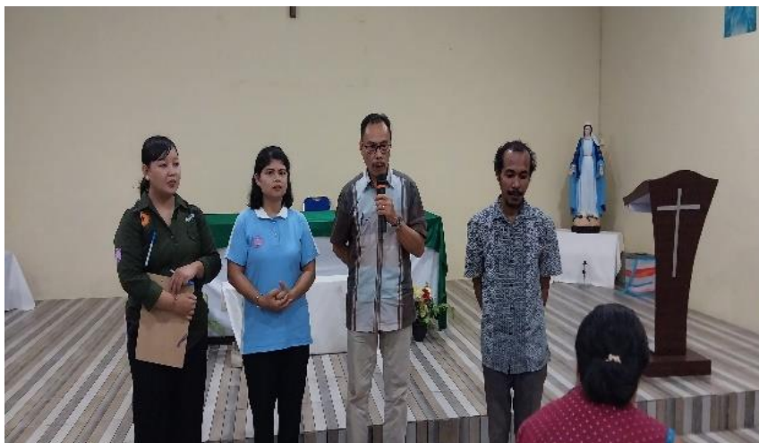
Gambar 2. Proses Perkenalan Tim Pengabdian

Berikut adalah foto-foto kegiatan pelaksanaan pengabdian kepada masyarakat di dusun Sungai Langer: