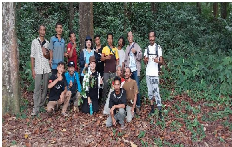
Gambar 7. Kunjungan ke Hutan Lindung