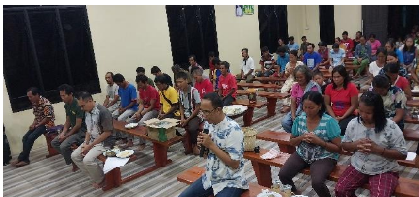
Gambar 4. Doa Pembuka